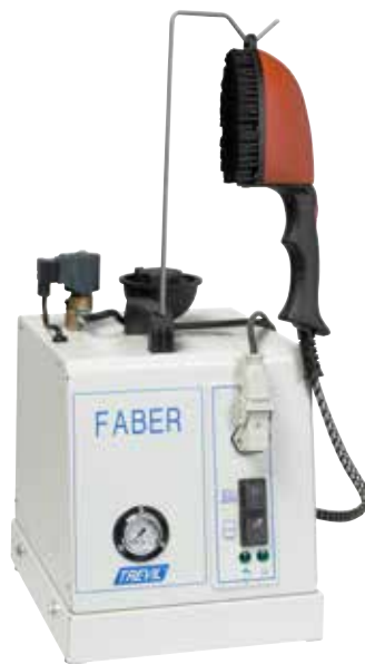
1235 Faber Speedy