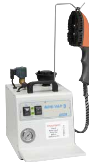
1017 Minivap Speedy