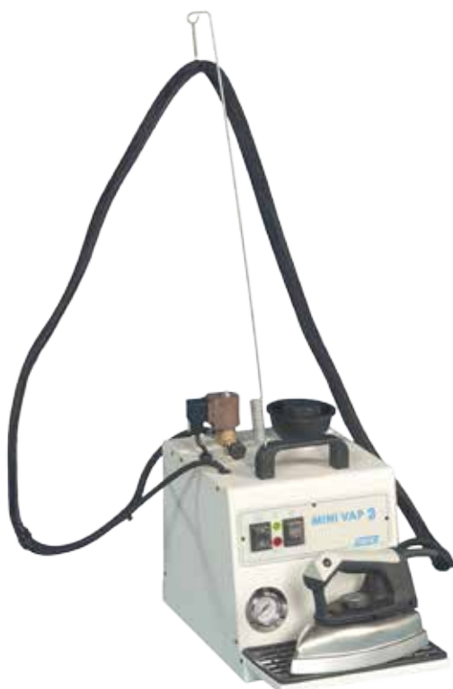
1014 Minivap 3