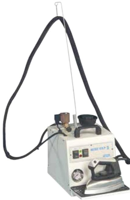
1014 Minivap 3