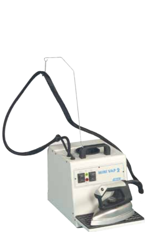
1013 Minivap 2