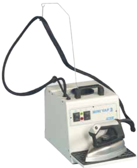
1013 Minivap 2